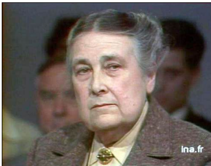
A Apostrophe , avec Bernard Pivot, le 13 avril 1979 sur Antenne 2.

Malgré tout, le synode reste traditionnel et renvoie la question à l'année suivante par deux fois. Il faudra attendre 1949 pour que la résolution soit enfin votée, mais à condition qu'elle s'engage à rester