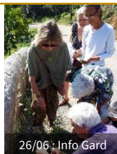
26/06 : Info Gard