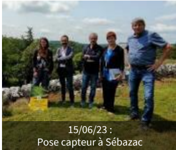
15/06/23 : Pose capteur à Sébazac