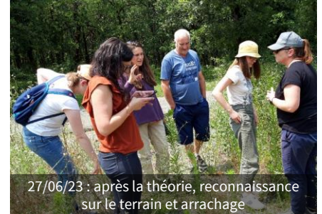
27/06/23 : après la théorie, reconnaissance sur le terrain et arrachage