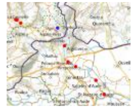
Les points amont et aval, et tout le long du cours d'eau

Comme décidé lors de la 1 ère réunion du plan de lutte territorial sur le bassin de la Cesse, le 6 juillet , 2 équipes de prospection ont parcouru le lit de la Cesse avec, pour objectif, d'identifier les points de présence d'ambrosie en amont et aval d'Agel et Bize-Minervoises. Quel n'a pas été notre dépit de découvrir des ambrosies jusqu'à l'embouchure avec l'Aude à Sallèles d'Aude ! Grâce à nos guides du SMMAR et de Sallèles d'Aude, plusieurs atterrissements ont été visités, tous déjà impactés sauf sous le Pont-Canal. La présence de plants à Mirepeisset n'a de ce fait pas été une surprise. Des arrachages partiels – faute de temps – ont été effectués. Aux localités de prendre le relais pour continuer ! Cela est déjà prévu à Bize-Minervoises , avec 2 chantiers de Jeunes du Grand-Narbonne les 26/07 et 02/08 auquel vous pouvez vous joindre ! (rens. 06 52 93 76 46). Côté Hérault, l'équipe est remontée au-delà de Minerve . Le point le plus en amont a été découvert à La Caunette . Un grand merci à la douzaine de prospecteurs, qui se sont retrouvés à Agel pour partager leurs découvertes, ainsi qu'un apéritif offert par la mairie.