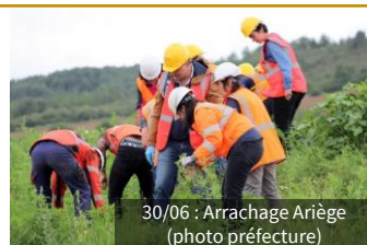
30/06 : Arrachage Ariège (photo préfecture)