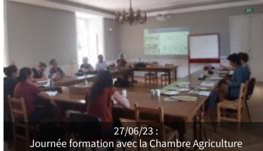
27/06/23 : Journée formation avec la Chambre Agriculture