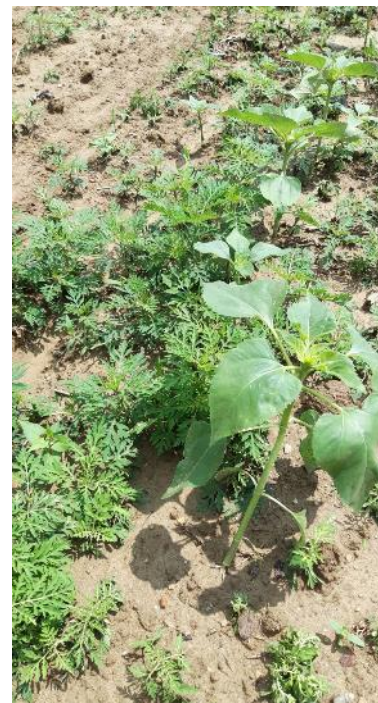
Dans un champ de Tournesol – Haute-Garonne

En bord de route, chemin ou bord de champ, ne vous pressez pas ! Il vaut mieux faucher juste avant floraison, soit le plus tard possible en juillet.