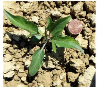
Germination d'ambrosie trifide. Si vous en rencontrez, signalez-la au plus vite !