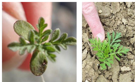
À la germination : cotylédons arrondis typiques (3 à 4 mm), tige velue, feuilles découpées (photos FREDON – début mai 2022).

Retrouvez l'encart ambrosie dans les bulletins de Santé du Végétal BSV-grandes cultures 2023 (voir p.16 pour le n°20)